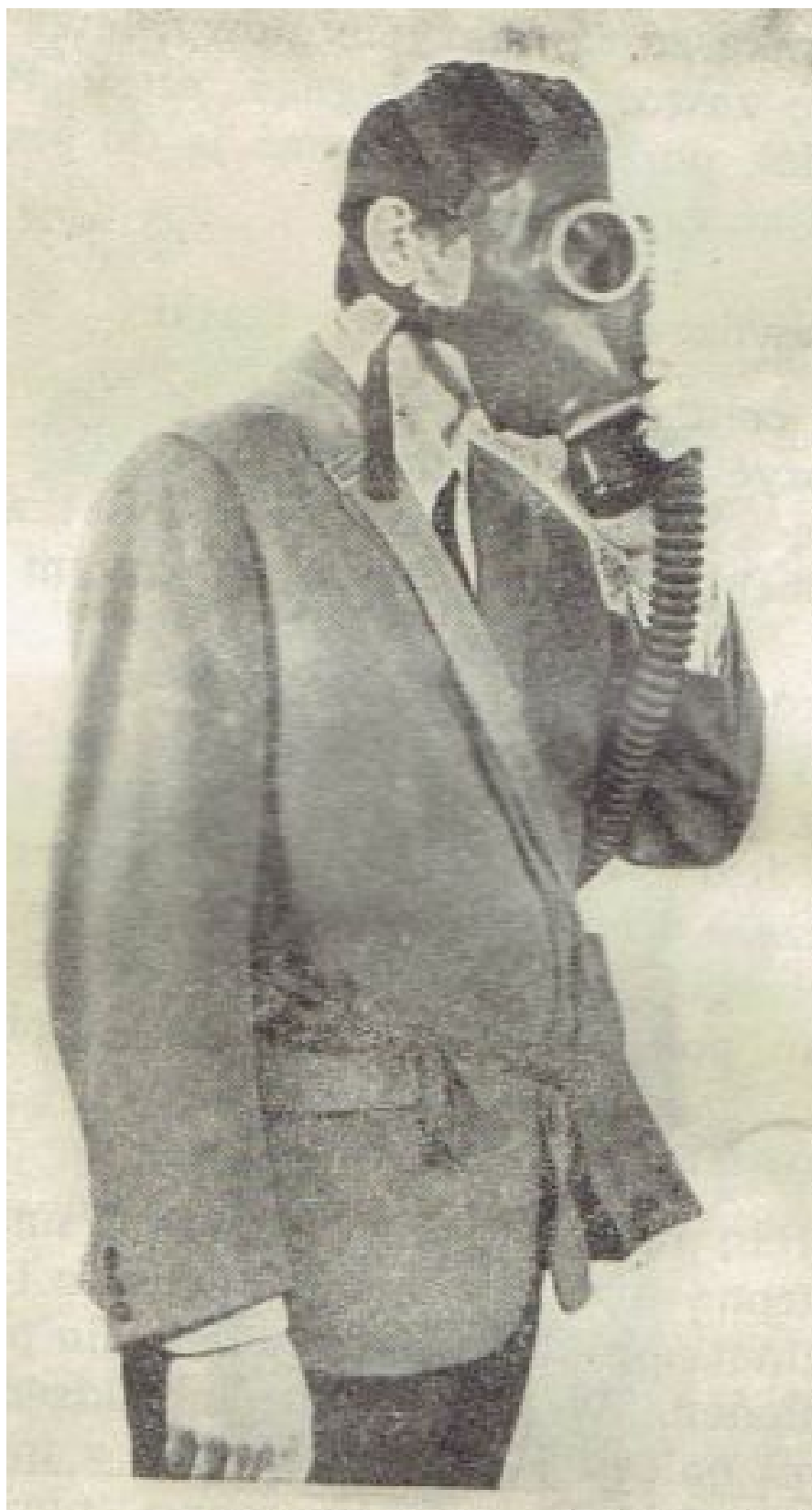
Rys. 7. Zdejmowanie części twarzowej