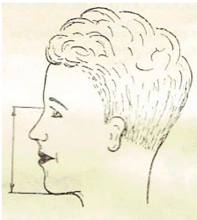
Rys. 2. sposób pomiaru twarzy

Część twarzowa produkowana jest w trzech rozmiarach: 1, 2 i 3.