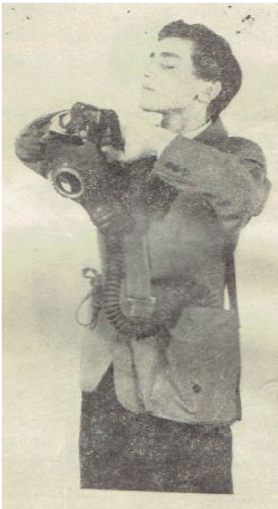
Rys. 6. Nakładanie części twarzowej