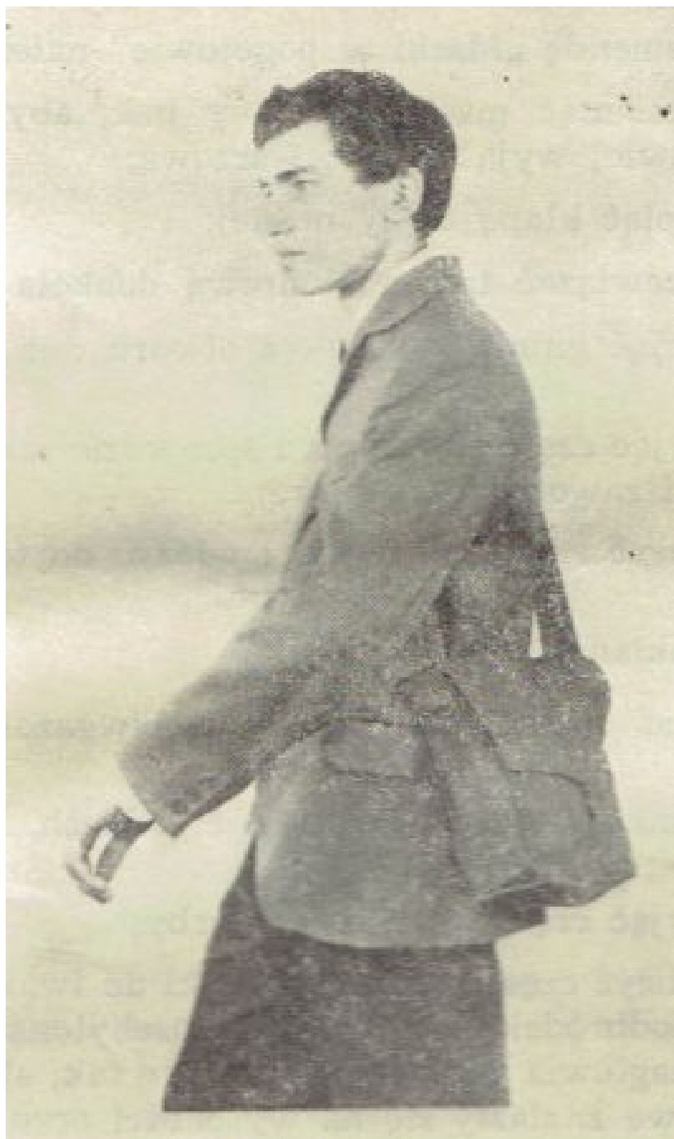
Rys. 4. Maska w położeniu marszowym