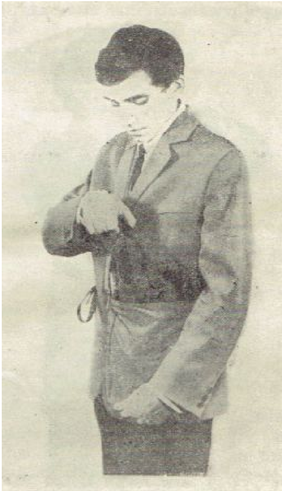
Rys. 5. Wyjmowanie części twarzowej z torby nośnej