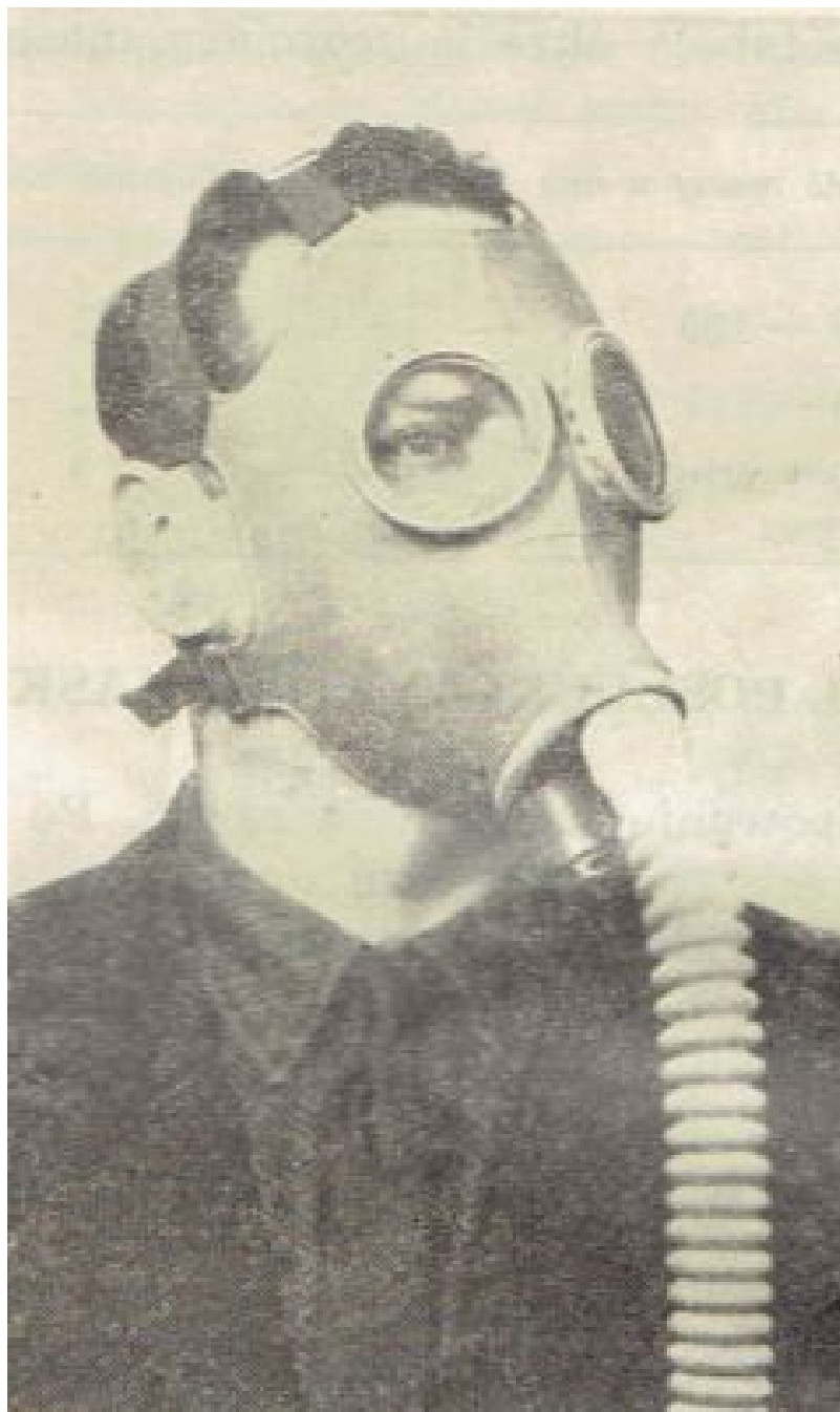
Rys. 3. Prawidłowe dopasowanie części twarzowej

6. Noszenie maski. Torbę z maską przeciwgazową nosi się na lewym boku z taśmą nośną przewieszoną przez prawe ramię. Kłapa torby powinna być zwrócona na zewnątrz. Górna krawędź torby powinna znajdować się na wysokości pasa.